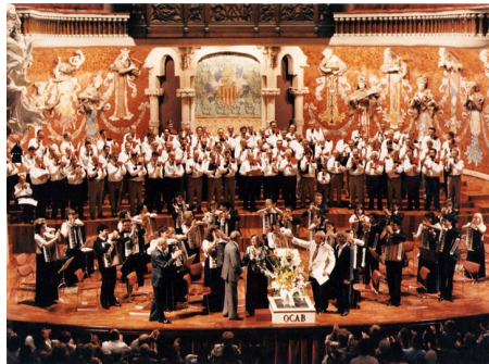
Palau de la Música Catalana - 30 de maig de 1993