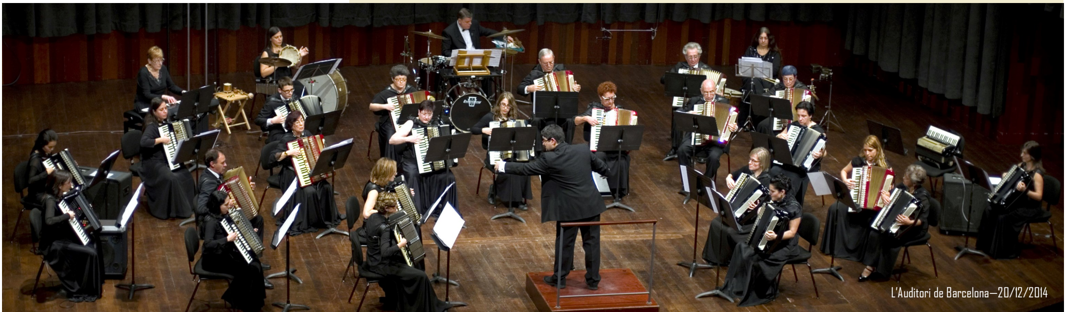
L'Auditori de Barcelona—20/12/2014

Paralel·lament a la seva activitat musical, el 1999 obté el Títol Superior d'Enginyer de Telecomunicacions a la Universitat Politècnica de Catalunya (UPC). Actualment és Responsable de Sistemes d'Informació i Comunicacions a l'Escola Tècnica Superior d'Enginyeria Industrial de Barcelona de la UPC.