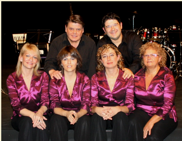
Camerata de l'OCAB

Nascut a Barcelona, va cursar estudis de Llenguatge musical, piano i percussió a l'Escola Municipal de Música de Barcelona. Ha format part com a bateria de varies de les formacions orquestrals de música lleugera més importants de la seva època. Des de fa uns quants anys s'ha dedicat a la percussió col·laborant amb diverses formacions d'estil clàssic, com ara l'Orquestra de Cambra d'Acordions de Barcelona des de l'any 2006, la Camerata de l'OCAB, l'Orquestra de flutes dolces del Coll de Barcelona (Musicus) i l'Orquestra Amics dels Clàssics.